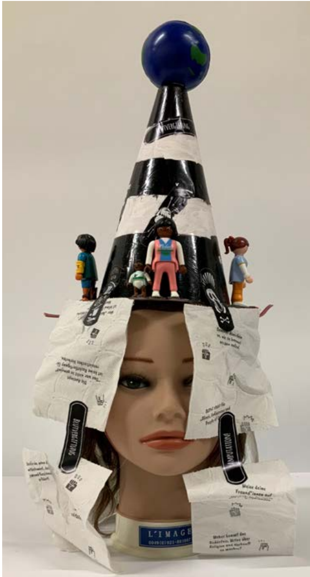
Um ein kleines Zeichen gegen Rassismus zu setzen. #blacklivesmatter